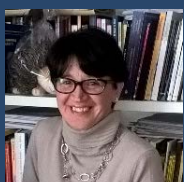
Prof.ssa FABIANA FUSCO (Università di Udine)